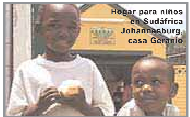
Hogar para niños en Sudáfrica Johannesburg, casa Geranio