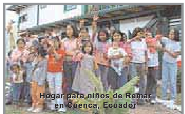
Hogar para niños de Remar en Cuenca, Ecuador