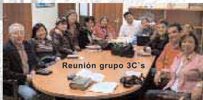
Reunión grupo 3C's

Las Tres C's es un ministerio de reuniones en los hogares de creyentes, cuyo propósito se define por el mismo nombre. Son tres la ces porque son las iniciales de los tres objetivos principales de estos grupos. Es la "C" de compartir el evangelio con otras personas; es la "C" de crecimiento espiritual; y es la "C" de compañerismo .